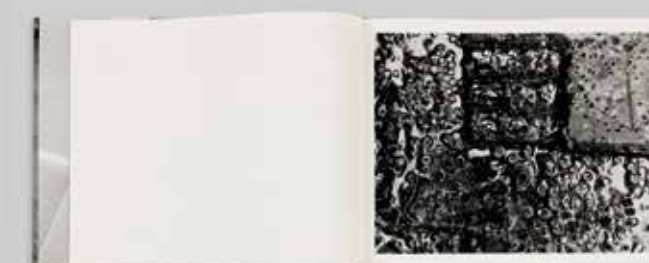
on | auf 02 (Basel, 2013, HdM/AWW/Serp) and on | auf 25 (Basel, 2014, HdM/AWW/Serp)