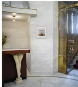
Installationsbild, Teatergrillen , 2024