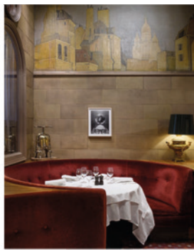
Mikael Olsson, Medusa, Caravaggio, Uffizi Gallery, Florence , 2023, 2023.