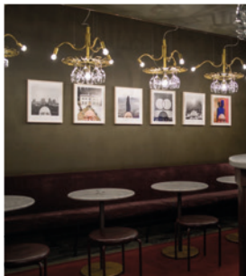
Installationsbild, Teatergrillen , 2024