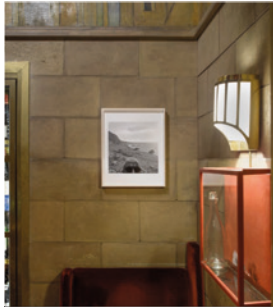
Mikael Olsson, The Seventh Seal, filming location, Hovs Hallar, Skåne , 2018, 2018.